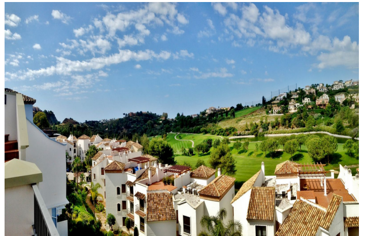
90 sq. mtrs. of rooftop solarium